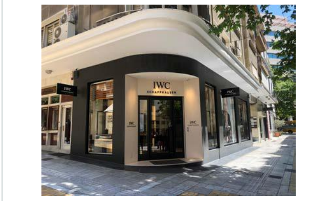
Πηγή: ΑΞΙΕΣ ΑΕ